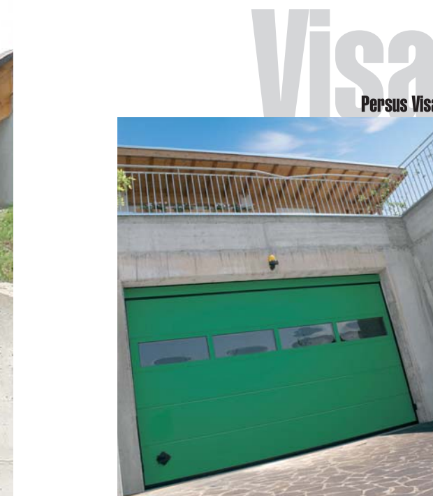
Persus Visa Stop&Go