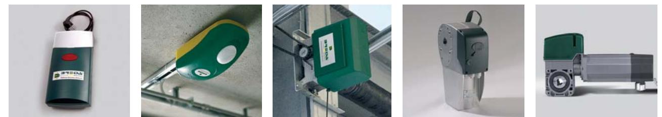
SL650 / SL800 V800E / V800PLUS CBY CBX STA1 / STA3

Breda è con voi sempre! Breda dispone di una Rete Vendita altamente qualificata, disponibile per ogni richiesta su tutta l'ampia gamma Breda. Per l'efficienza e la durata del prodotto, richiedere al rivenditore informazioni sulla "manutenzione programmata" (indispensabile per la validità della garanzia).