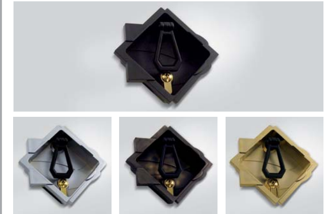
Cromata / Chromed / Verchromt Bronzata / Bronzed / Bronze Dorata / Gold-Plated / Vergoldet