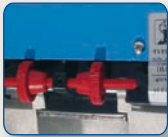
Finecorsa incorporato regolabile