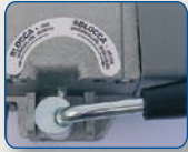
Sistema di sblocco con leva in caso di assenza di energia elettrica