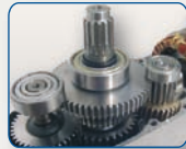
Ingranaggi trattati termicamente e calettati su alberi rotanti supportati da cuscinetti; vite senza file in acciaio bonificato e corona in bronzo