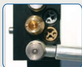
Valvole di regolazione forza