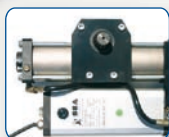
Centralina e Martinetto