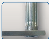
Sistema di sblocco tramite leva posta sull'attuatore con cavo